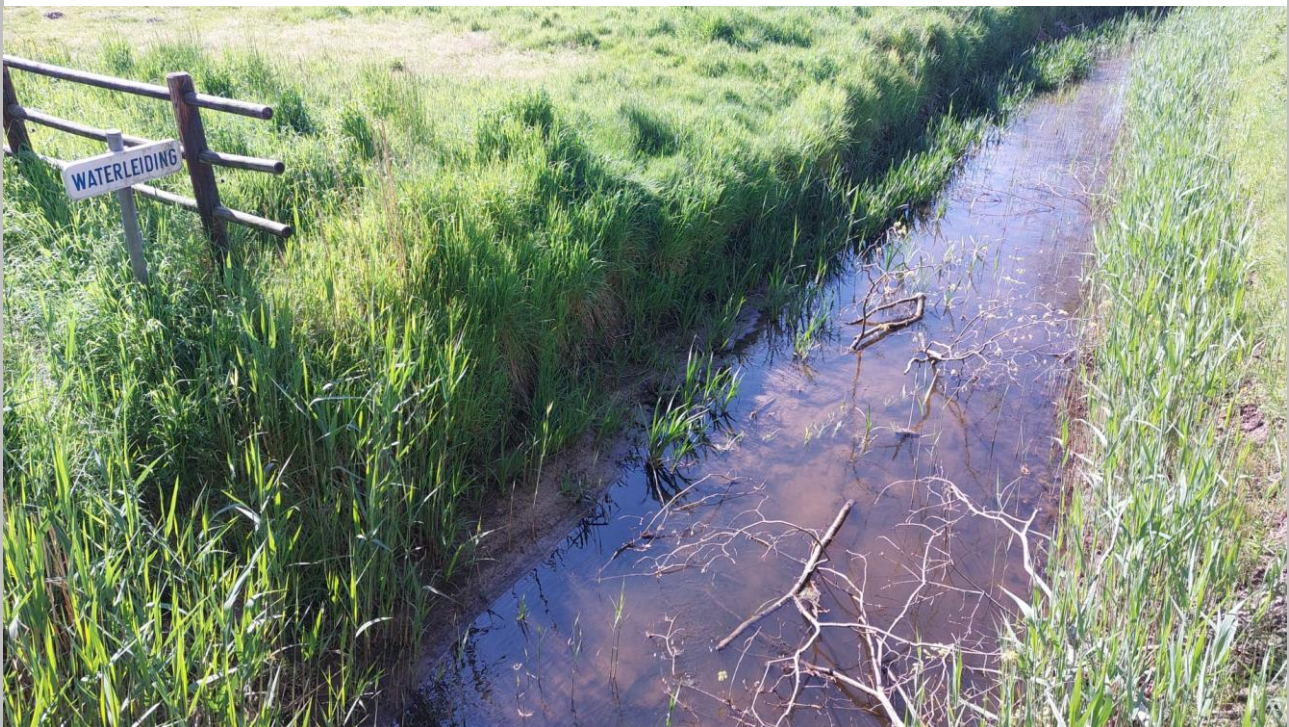
De Aa te Oud-Turnhout op 3 mei 2022

Sinds 1 januari 2022 geldt een permanent onttrekkingsverbod op alle ecologisch zeer kwetsbare kleine beken in de provincie Antwerpen. Dit verbod blijft van toepassing.