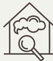
Binnenlucht, huisstof & water

Meer info: www.omgeving-en-gezondheid.be