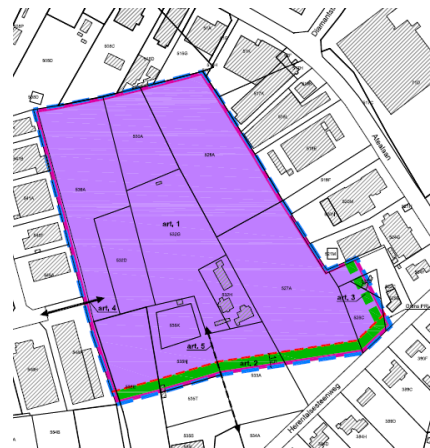
Figuur 4: ontwerp-PRUP