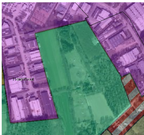
Figuur 3: bestemmingen gewestplan